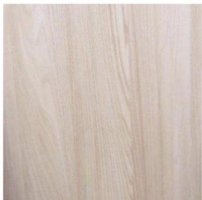
369 榆木 厚度:8.18.40.50mm