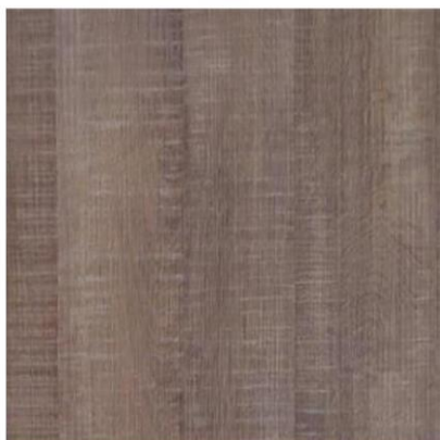
1151 棕橡木 厚度:8.18.25.40.50mm 木心板