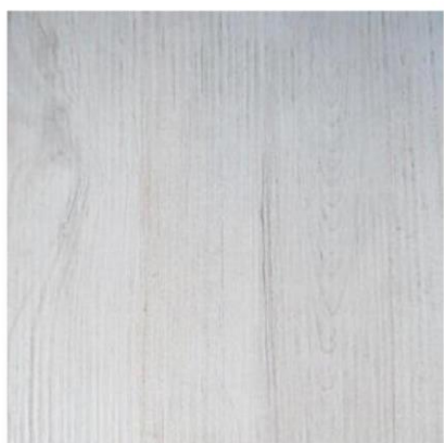
3060 白色北歐木 厚度:8.18.25mm