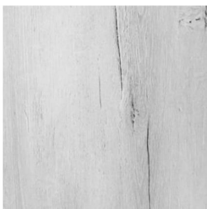
5310 水洗橡木 厚度:18mm