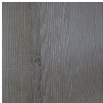
1267 鄉村柺木 厚度:8.18.40.50mm