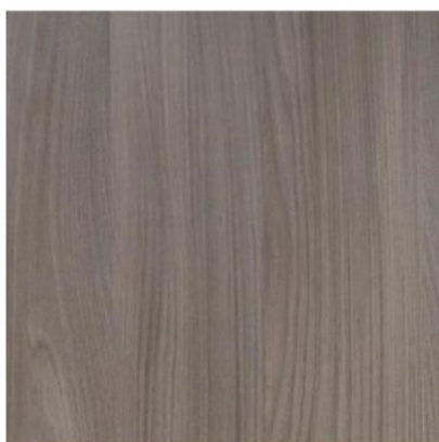
4305 紫羅蘭 厚度:8.18.25mm