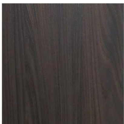
4859 黑金剛 厚度:8.18.25mm