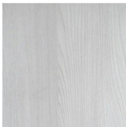
4143 銀絲榆木 厚度:8.18.25mm